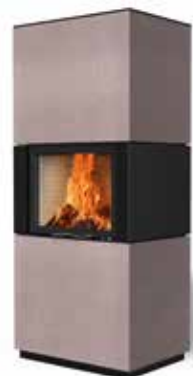
Colin 65 Beton terra