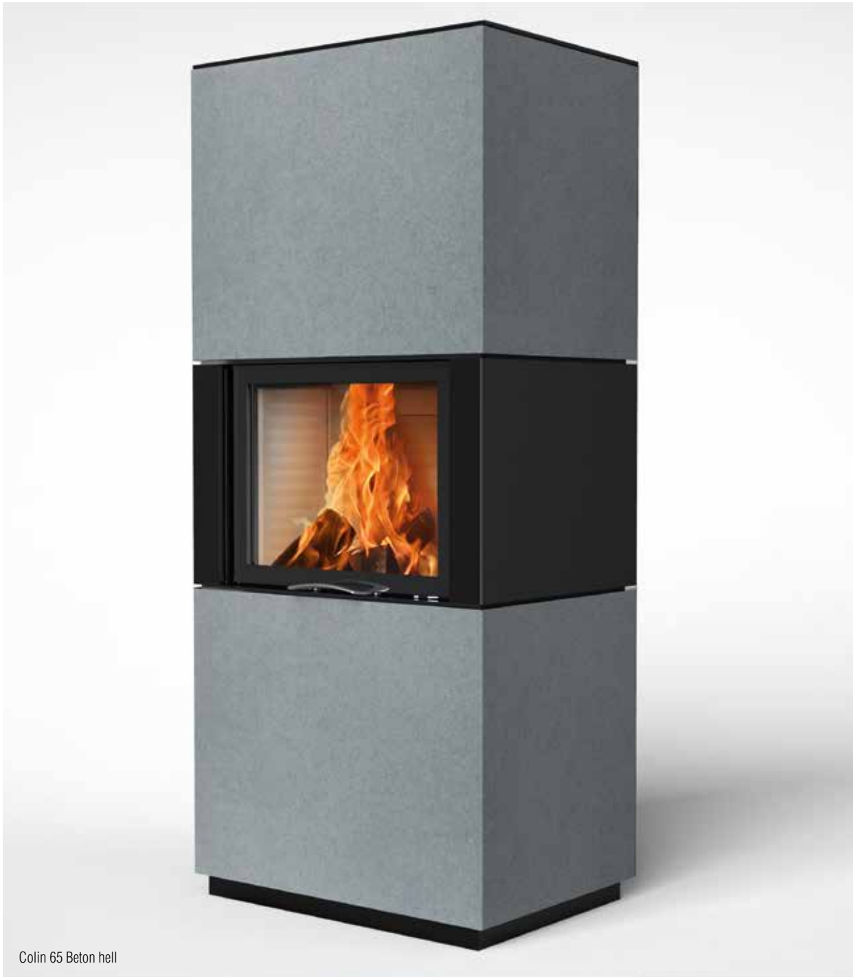
Colin 65 Beton hell