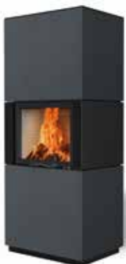
Colin 65 Beton anthrazit