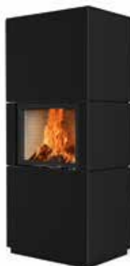
Colin 65 Stahl