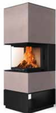
Mel 55 Beton terra