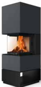
Mel 55 Beton anthrazit