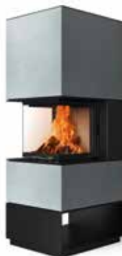
Mel 55 Beton hell